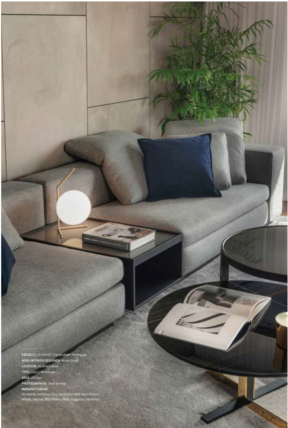
PROJECT: LS HOUSE | The Southern Penthouse HEAD INTERIOR DESIGNER: Moran Gozali LOCATION: Southern Israel TYPE: Luxury Penthouse AREA: 260 sqm MANUFACTURERS: Rimadesio, Blüthlip, Flos, Lee broom, B&B Italia, Molteni, Minotti, Voia tap, MGS Milano, Melle, Gaggenau, bontempi.