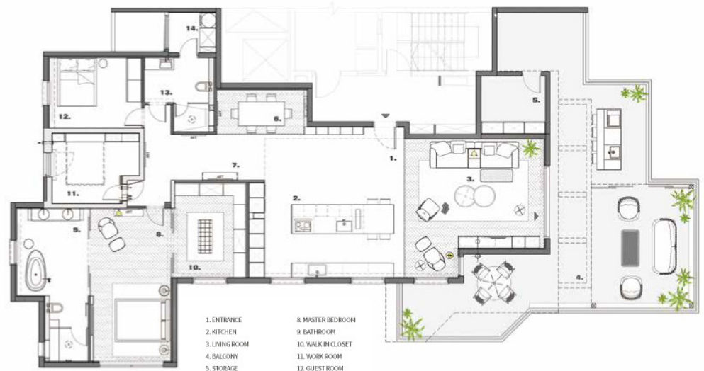
LS HOUSE | LAYOUT PLAN STUDIO MORAN GOZALI